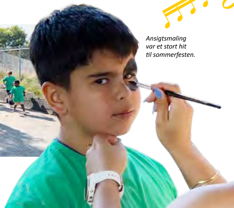
Ansigtsmaling var et stort hit til sommerfesten.